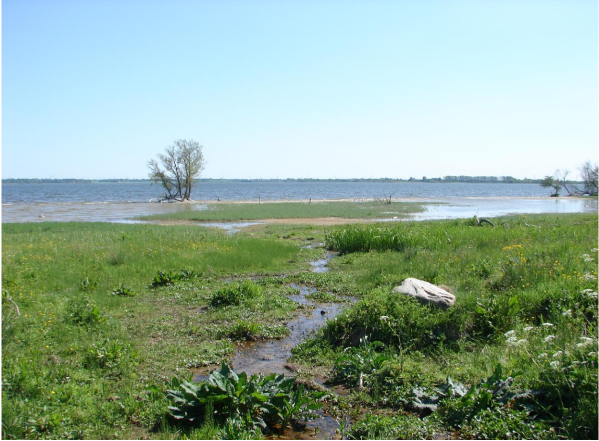
Figur 3. Et lille vandløb løber ud i Tissø syd for pumpestationen. Længst ude mod Tissø står en stor bevoksning af Hestehale.

Tak til Lars Hansen fordi vi fik lejlighed til at besøge denne lille naturperle.