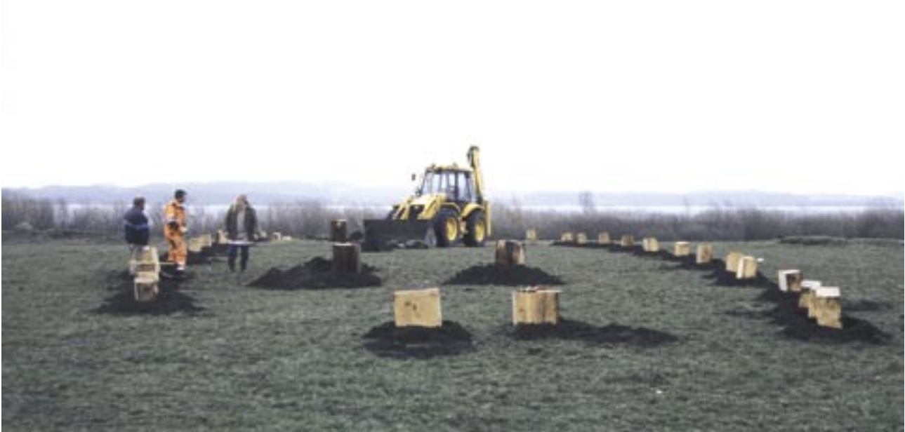
Fig. 10. Stormandsædet ved Tissø. Stolpesporene efter landets største hus fra vikingetiden afmærkes med trækævlere.

vokset til, fordi de er privat ejendom, eller fordi de ligger uden for alfarvej og ofte er svært aflæselige for besøgende uden stort lokalt kendskab. Naturpleje, vådgøring, etablering af offentlige stier og formidlingssteder kan give landskabet en betydelig større oplevelsesværdi.