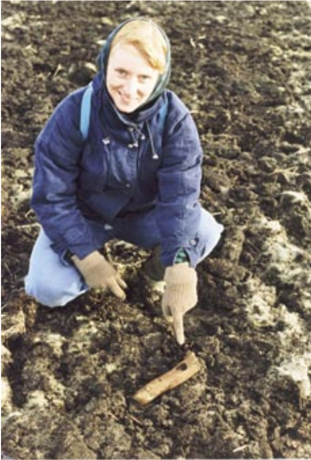
Fig. 8. En nyoppløjet, ca. 8000 år gammel økse af hjortetak. Åmosen er et af de vigtigste fundsteder i Europa for våben og redskaber af organiske materialer fra de første 5-6000 år efter istiden. Glæden ved fundet af denne økse blev nedtonet ved den beklemmende vished om, at dræningen for længst havde fået dens skaft til at rådne bort, og at ploven havde ødelagt den boplads, som øksen hørte sammen med. Foto Claus Jensen 1988.

Tørvegravningen har efterladt sig talrige spor i landsbyerne omkring mosen, hvor historien kan gøres nærværende ved at fortælle om husenes funktioner som briketfabrikker, pensionater o.l. Vedde Station med læsseramper ser ud som dengang, det sidst tog med tørv kørte mod København. En gård i tilknytning til Store Åmose kan stadig producere tørv til eget brug. En anden opbevarer en stor samling gamle landbrugs- og tørvegravningsredskaber.