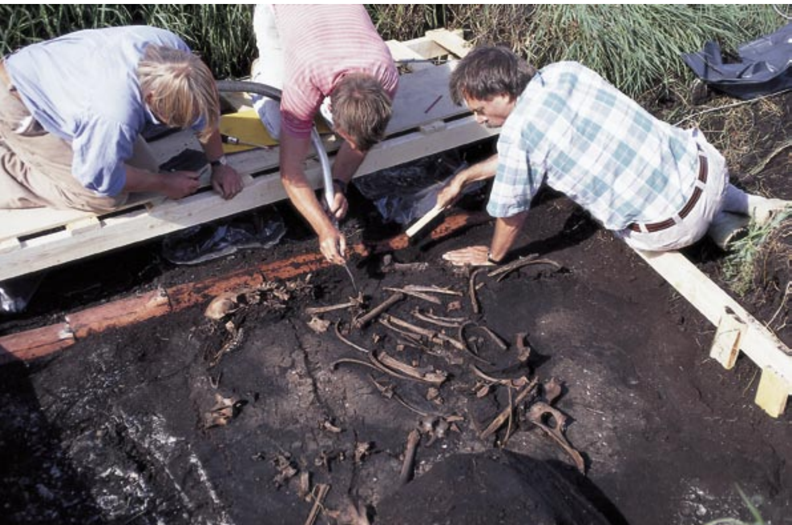
Fig. 7. Udgravning af et skelet af en kronhjort, som druknede i Kongemose i Store Åmose i stenalderen – muligvis efter en mislykket jagt. Mosens mange velbevarede dyreknogeter gør den til et unikt arkiv over dyrelivets udvikling i Nordeuropas stenalder. Foto Geert Brovad, Zoologisk Museum 1995.

Store Åmose har indskrevet sig med et ganske særligt kapitel i tørvegravningens historie i Danmark. Under 2. Verdenskrig blev den Sjællands største leverandør af brændsel. Et industrikonsortium fra København lejede sig ind i mosen for at sikre energi til deres produktioner. Det beskæftigede et fircifret antal personer og snesevis af hestespannd. Dertil kom 12 km togspor, talrige transportbånd og meget støv. Det er denne industri, der lagde grunden til de vidtstrakte flader, som ses i mosebassinet i dag. Fortællingerne om dette "tørveeventyr" handler om hårdt arbejde, hurtige penge, snavs, barakbyer, beværtninger og et bordel samt Danmarks formentlig første naturbørnehave for de mange børn, der måtte friste en tilværelse ude i tørven sammen med deres forældre.