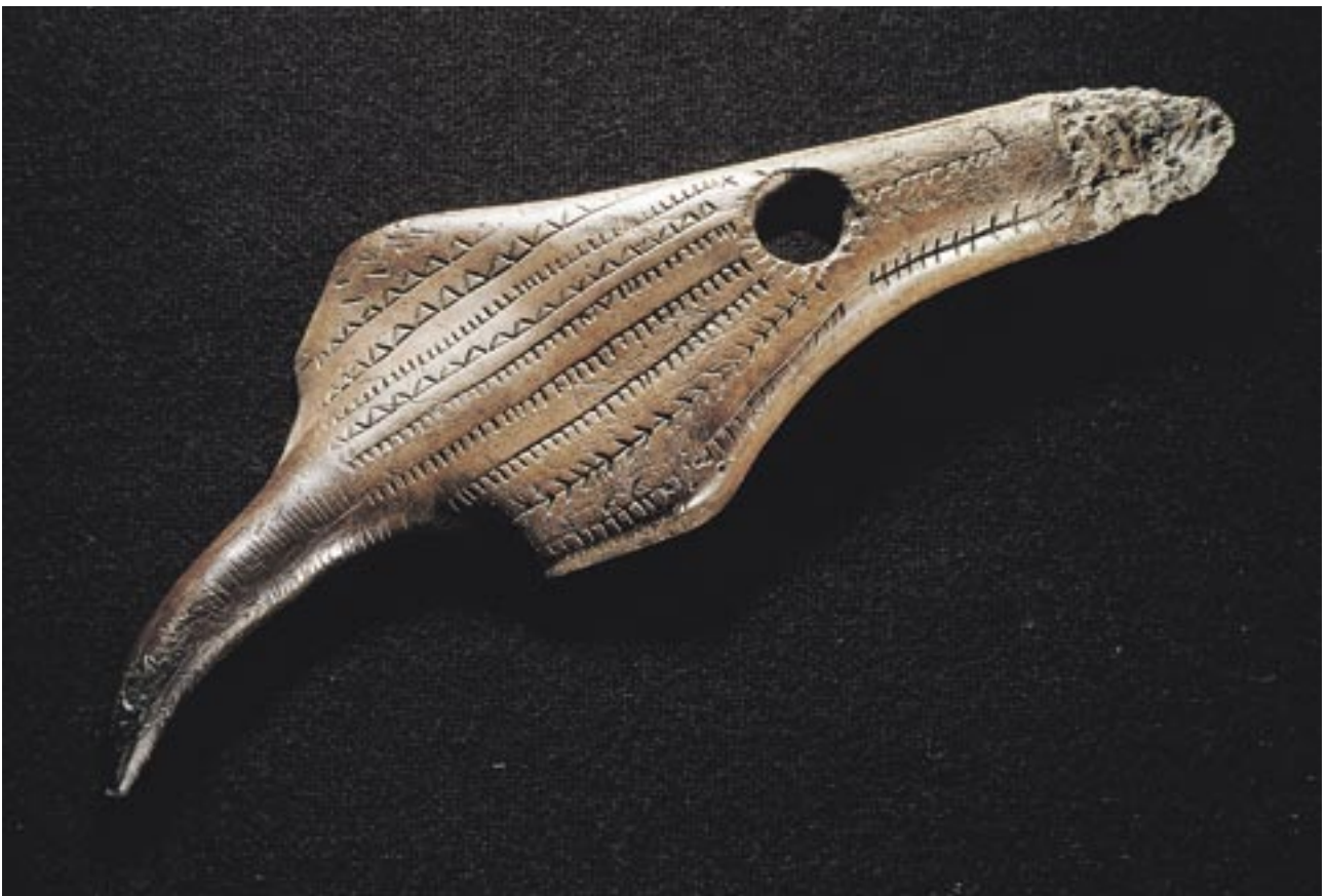
Fig. 6. Kunst indridset i våben af elsdyr- og kronhjortetak fra de senere årtusinder af ældre stenalder. Åmosen er den vigtigste lokalitet for sådanne fund i Europa. Jagtscene fra glatskrabet hjortetak, fundet ved tørvegravning et ikke nærmere kendt sted i Åmosen; dekoreret våben fra Dyssemosen ved Ugerløse; Venus fra Jorløse Mose; dansemanden fra Kongemose. Gengivet efter Andersen 2001; Petersen 1990; Fischer 1990.