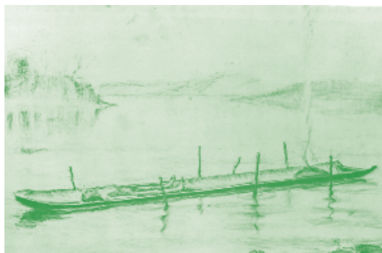
Fig. 5. Rekonstruktion af et kultfund i Store Åmose, dateret til yngre stenalder, hvor mosens var en af de vigtigste lokaliteter i Europa for ofringer i vådbund. Tegning B. Brorson Christensen, gengivet efter Fischer 2004.

Tørvelagene i Store og Lille Åmose har bevaret talrige spor af menneskers liv i de ældste epoker af Danmarkshistorien (fig. 5). Intet andet sted i Europa kan fremvise en så rig og varieret kulturarv fra perioden 9000- 3000 f. Kr. (fig. 6). Særlige bevaringsforhold i tørvelagene gør dem til ar-