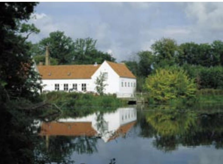
Fig. 2. Strids Mølle – et stemningsfuldt kultur- og naturmiljø med stor fortællerværdi om de forskellige epoker i industrialiseringen.

landskaber er afhængige af kulturbetingede landskabselementer.