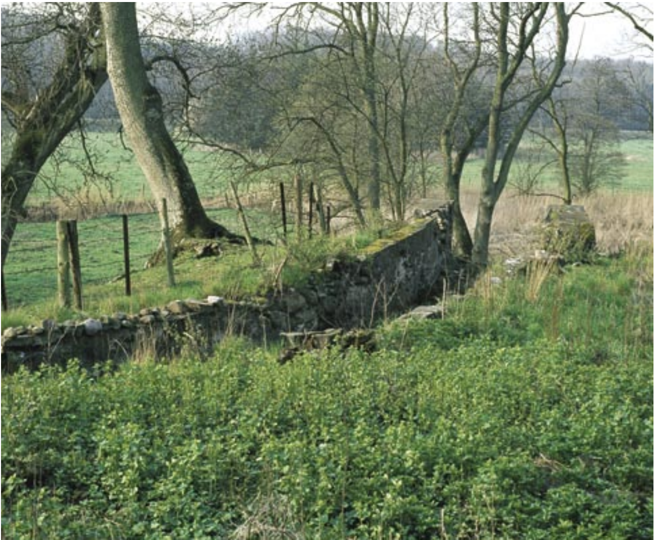
Fig. 4. Ruiner af møllekanalen ved Gryde Mølle. Engen i baggrunden var tidligere møllesø til Øresø Mølle. Denne møllesø foreslås nu genskabt.