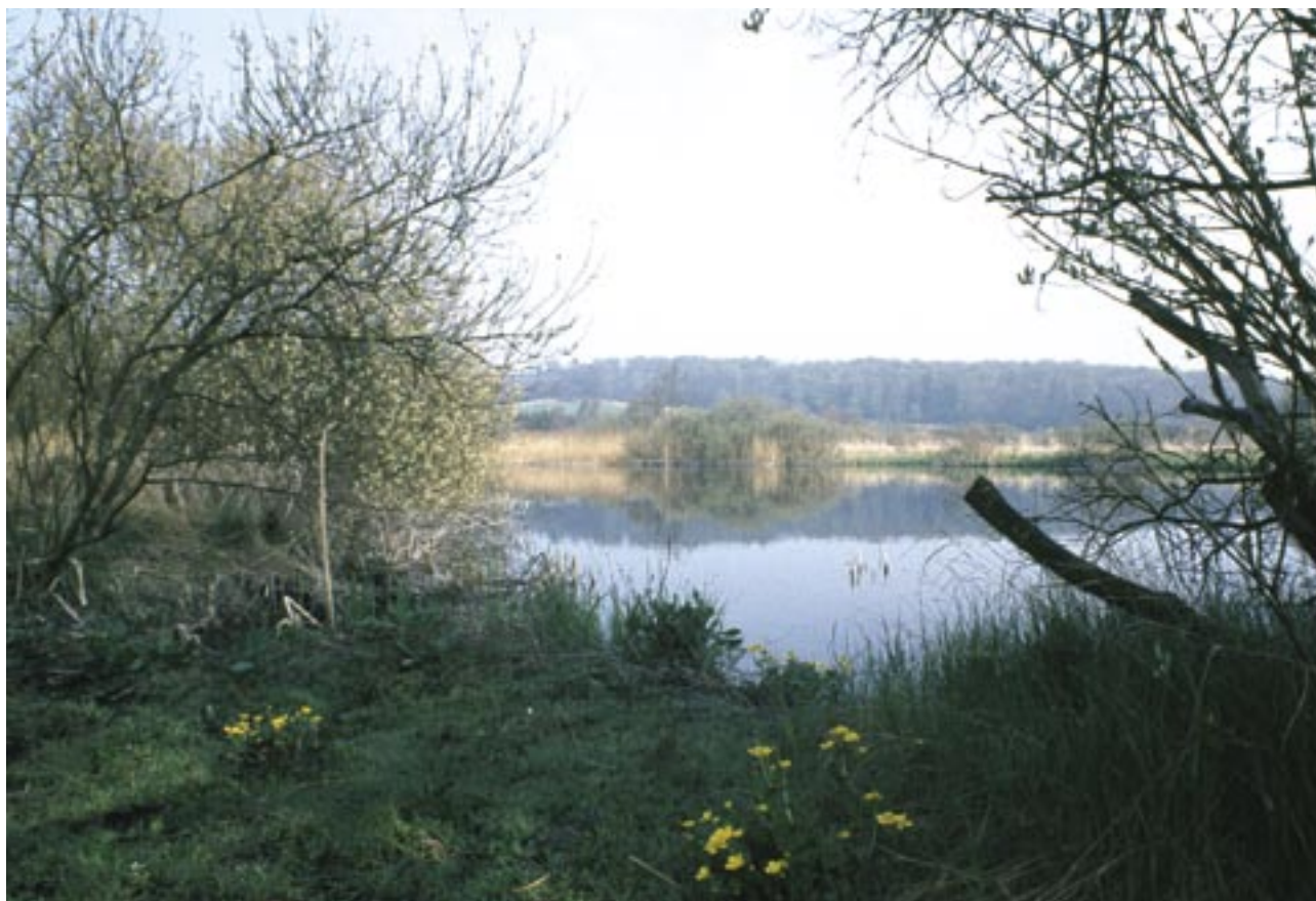
Fig. 3. Et vandfyldt tørveskær i Lille Åmose – et eksempel på den nære sammenhæng mellem kultur og natur i Sjællands Grønne Hjerte. Når den gråstrubede lappedykker i dag skrider hjerteskræende i de gamle tørveskær, så er det kun muligt, fordi talrige arbejdsmænd før hen gravede tørv i mosen. Tørvegravningen bragte værdifulde fund fra oldtiden for dagens lys. Mange af dem er havnet på de lokale museer og på Nationalmuseet. Endnu flere blev ødelagt. De vandmættede moselag under og mellem tørveskærene må være lige så rige på velbevarede fortidsminder. De vil være et uvurderligt videnskabeligt skatkammer for fremtidige generationer.

Til visionen knytter sig også planerne om at etablere et par informationscentre. Inde i Store Åmose vil børn og barnlige sjæle kunne lege stenalder, prøve datidens fartøjer, fange fisk og lave mad, som man gjorde i de tidligste tider. Mange af de plante- og dyrearter, som vore forfædre levede af i ældre stenalder, findes fortsat i Åmose-området. Det giver mulighed for kombineret undervisning i historie, biologi og primitiv madlavning. På formidlingscentret i Åmosen vil man også kunne erfare de barske vilkår med at grave, vende og røgle tørv, som var hverdagen for børn og voksne i lange perioder af 1900-årene. Ved besøg på formidlingscentret ved Tissø vil man kunne stifte bekendtskab med hedenske vikingers og kristne ridders verden. Til sammen vil de to centre kunne danne udgangspunkter for talrige oplevelser i naturen og historien.