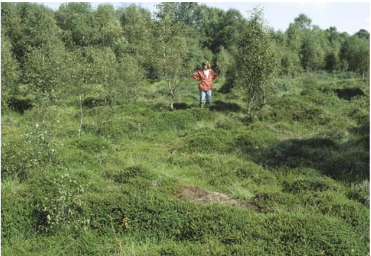
Fig. 9. Rest af højmosen i Ulkestrup Lyng. Den lidt ujævne overflade skyldes, at området er dækket af gamle tørvegrave.

I de uopdyrkede dele af østlige Store Åmose findes tørveskær af mange forskellige aldre og udformninger (fig. 9). Fælles for mange af kulturmiljøerne, der fortæller om tørvegravningen i mosen, er, at de er utilgængelige, fordi de er