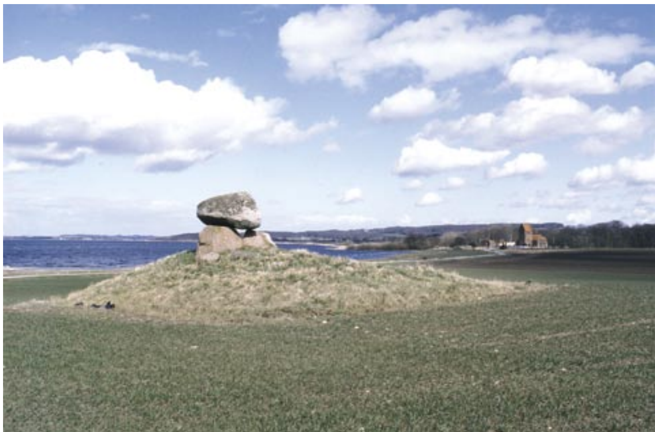
Fig. 11. Monumentale kult anlæg ved Tissø: En 5000 år gammel dysse og en knap 1000 år gammel kirke ved søbredden ved Sæby. Gennem årtusinder har der været nær forbindelse mellem vand og religion i Åmose-Tissø-dalen. Foto A. Fischer 1995.

Den dag i dag vil besøgende på krydstogt blandt kultur- og naturperler i Sjællands Grønne Hjerter være henvist til at søge mod de få naturlige overgange, der siden Arilds tid førte trafikken uden om søerne og moserne. Først omkring 1850 blev det muligt at køre over bro midt i Store Åmose. Denne bro syd for Skellingsted har været fornyet flere gange i forbindelse med afvanding