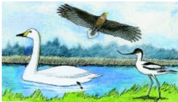
Pibesvane Havørn Klyde

Søen ligger i et såkaldt dødshul fra sidste istids ophør. Dødshullet er opstået i forbindelse med smeltning af en stor isblok, der blev efterladt på stedet efter at være blevet adskilt fra hovedgletcheren.