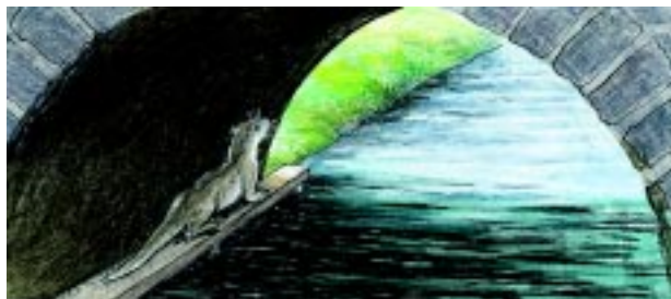
Odder under bro

Odderen vil ikke svømme under broer. Derfor har det været nødvendigt at sikre odderens vandreruter langs åsystemet ved at etablere gangbrædder under broer, så odderne ikke behøver at krydse veje med fare for at blive kørt ihjel. Odderbestandens størrelse kendes ikke, men den er ikke særlig stor.