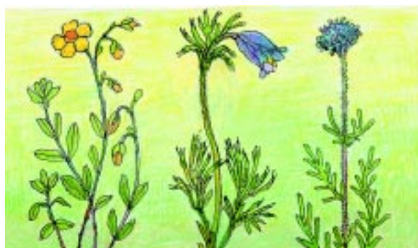
Soløje Nikkende Kobjælde Vellugtende Skabiose