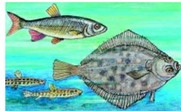
Pigsmerling Rimte Skrubbe